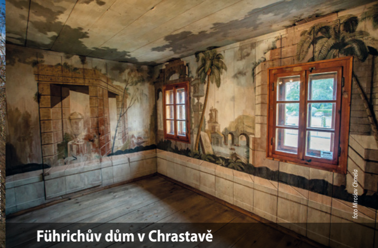
Führichův dům v Chrastavě

Otevírací doba: so 10.00 – 17.00; ne 10.00 – 17.00