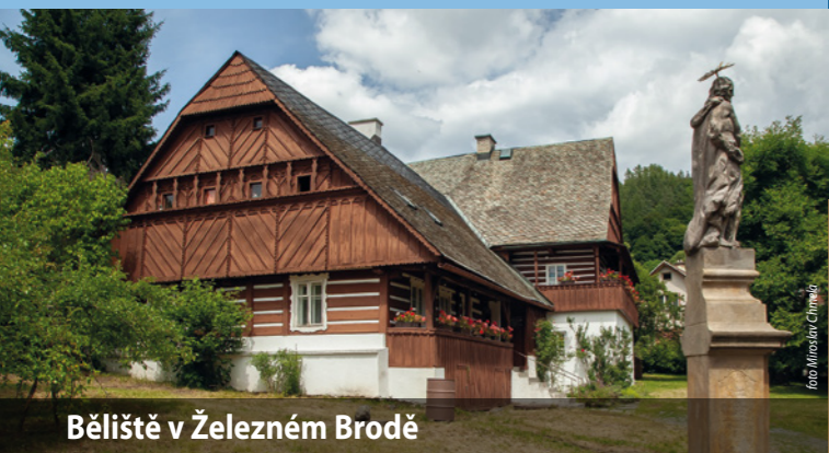
Bělíšť v Železném Brodě

Otevírací doba: so 10.00 – 14.00; ne 10.00 – 14.00 www.chrastava.cz