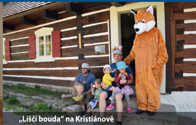
„Liščí bouda“ na Kristiánově

Otevírací doba: so 9.00 – 17.00; ne 9.00 – 17.00 www.muzeum-turnov.cz