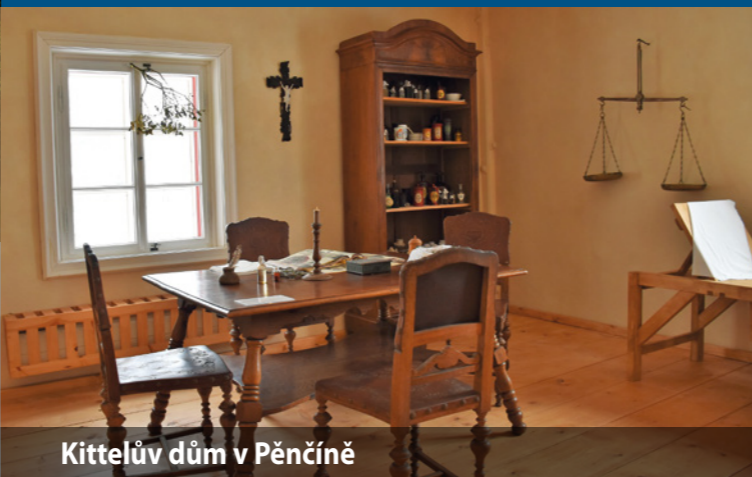
Kittelův dům v Pěčíně

Otevírací doba: so 9.00 – 17.00; ne 9.00 – 17.00 http://muzeumzb.cz/