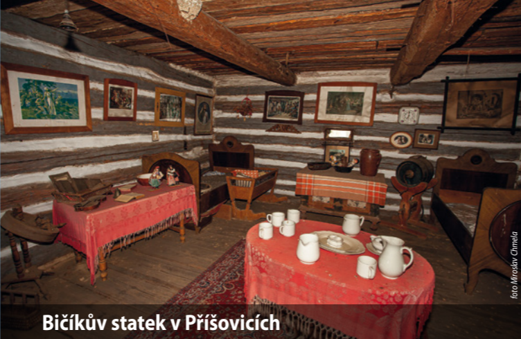
Bičíkův statek v Příšovicích

http://lidove-stavby.cz ; www.kraj-lbc.cz