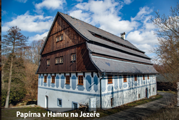
Papírna v Hamru na Jezeře

Otevírací doba: so 10.00 – 17.00; ne 10.00 – 17.00 www.prisovice.cz